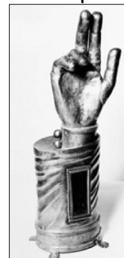
Le bras reliquaire de Saint-Mary

Comme promis par le maire lors de la fête de Saint Mary ce 2 août dernier, le conseil municipal a délibéré le 28 novembre pour un projet d'élaboration d'une vitrine sécurisée pour le bras reliquaire de Saint Mary (15 ème siècle) avec la main bénissante en cuivre, classé monument historique, au sein de l'église du bourg de Ferrières. La réalisation est confiée à l'entreprise Besse Rénovation de Saint-Flour pour un coût total de 8.232 euros dont 4.116 euros de subvention du département du Cantal et une participation de l'association « Autour du Mont Journal ».